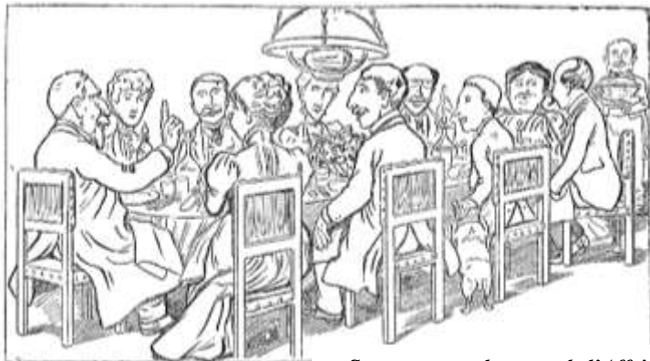
« Surtout, ne parlons pas de l’Affaire Dreyfus ! »

Document n°1 : « Un dîner en famille », caricature dessinée par Caran d’Ache et parue dans le journal le Figaro en 1898.