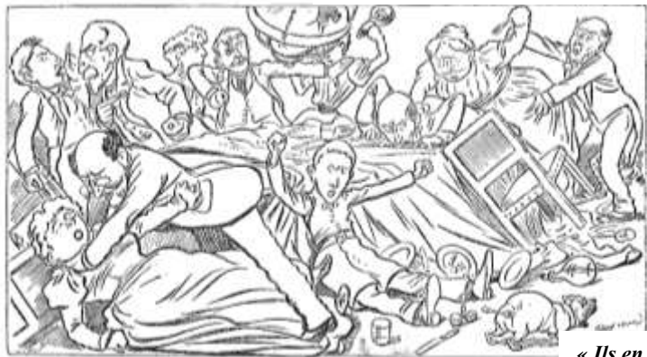
« Ils en ont parlé... »

Document n°2 : Un instituteur explique comment l’affaire Dreyfus s’est propagée dans la population française.