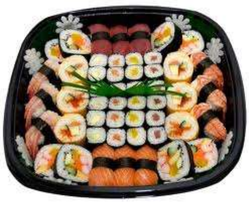
Plat de sushis