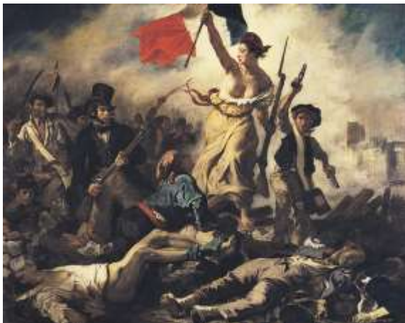
La Liberté guidant le peuple, tableau d'Eugène Delacroix, 1830.

A ces symboles s'ajoutent la fête nationale du 14 juillet qui rappelle la prise de la Bastille (1789) et le visage de Marianne (femme qui porte le bonnet phrygien ) qui représente la République et que l'on retrouve sur de nombreux documents et tableaux ( La Liberté guidant le Peuple ). L'Histoire de la République a été aussi marquée par plusieurs textes fondateurs : le La Déclaration des Droits de l'Homme et du Citoyen (1789, « Les Hommes naissent et demeurent libres et égaux en droits ») ; le Constitution de la Vème République (1958, « La France est une République indivisible, laïque, démocratique et sociale ») ; le loi sur la séparation des Eglises et de l'Etat (1905, principe de la laïcité). On peut aussi ajouter le traité de Maastricht (1992) qui permet à chaque citoyen français de bénéficier aussi d'une citoyenneté dans l'Union Européenne (circulation, installation, travail...).