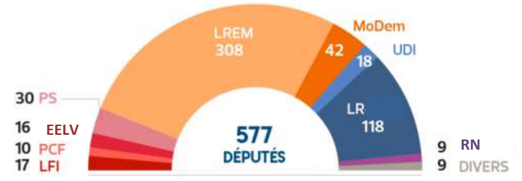
Document n°1 : Répartition des partis politiques dans l'Assemblée Nationale française (élections de 2017).

1/ D'après ce document, quels sont les cinq partis politiques qui ont le plus de députés à l'Assemblée Nationale (précisez leur nombre entre parenthèses) ?