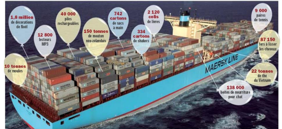
Un trajet entre l'Asie et l'Europe sur ce navire est facturé environ 2 000 € par conteneur.

6/ Calculez la valeur marchande globale d'un navire rempli de 11 000 conteneurs :