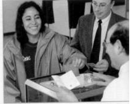
Dès 18 ans, vous pouvez voter aux élections. Mais il faut pour cela être inscrit sur les listes.

Pour pouvoir se présenter à une élection, il faut avant tout être électeur et de nationalité française. Des conditions spéci-