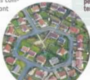
◀ Lotissement pavillonnaire en Eure-et-Loir.

L'étalement urbain se produit au détriment des terres agricoles (doc. 3 p. 277).